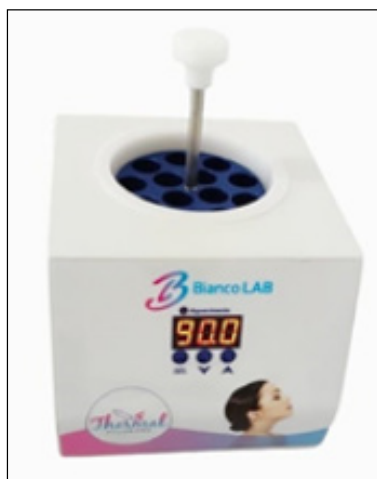
Figura 2 - Incubadora de Plasma Gel.

aquece as mesmas uma temperatura de 90°C para desnaturação da albumina, fibrinogênio e outras proteínas contidas no plasma (Figura 2). Cada uma das seringas de tamanhos diferentes ficou por tempos diferentes a fim de obtenção de 3 densidades diferentes, baixa, média e alta.