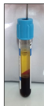
Figura 1 - Amostra Centrifugada.